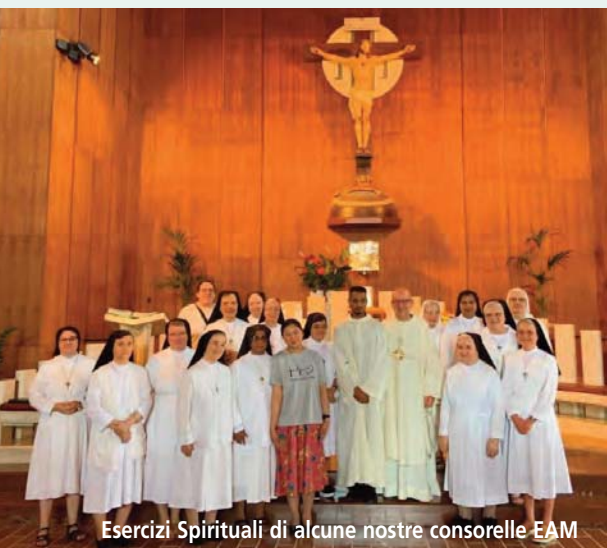
Esercizi Spirituali di alcune nostre consorelle EAM

Nell'ultima domenica del mese abbiamo celebrato con gioia la prima professione,