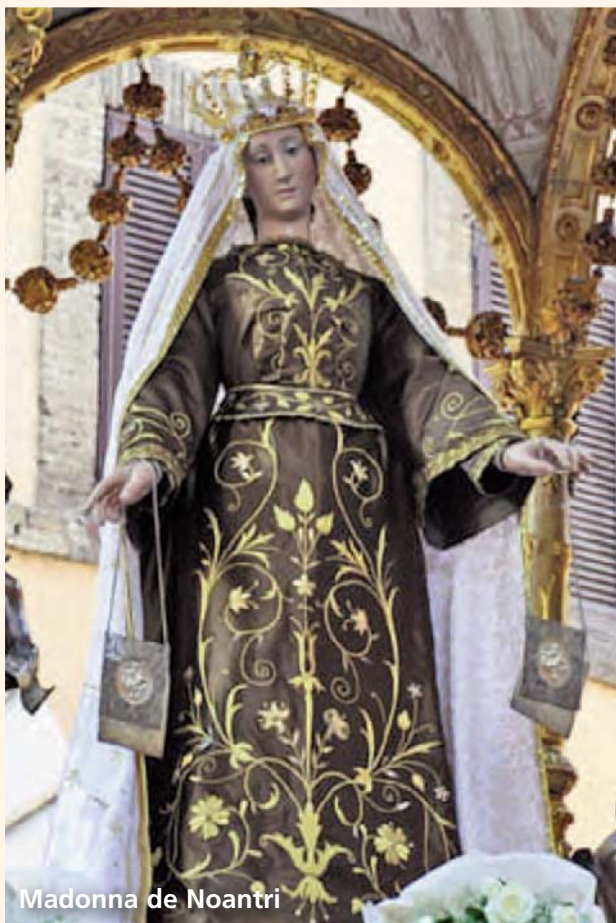
Madonna de Noantri

La statua della Madonna del Carmelo attualmente è conservata nella chiesa di S. Agata a Trastevere. Come risulta dall'iconografia classica, non tiene il Bambino in braccio, ma rivolge le braccia verso il basso ed è