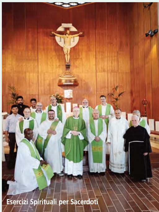
Esercizi Spirituali per Sacerdoti

A fine mese, dal 29 luglio al 2 agosto, c'è stato un altro corso di Esercizi Spirituali per sacerdoti diocesani, guidato da P. Aurelio Pérez, sempre sul tema della preghiera nella vita del presbitero: "Quando pregate dite: Abbà, Padre!".