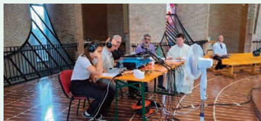
Collegamento con Radio Maria per Rosario, Vespri e Santa Messa

Desidero anche ricordare la trasmissione pomeridiana di Radio Maria dal nostro