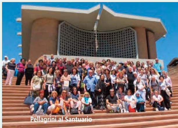
Pellegrini al Santuario