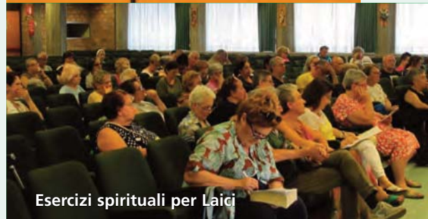
Esercizi spirituali per Laici