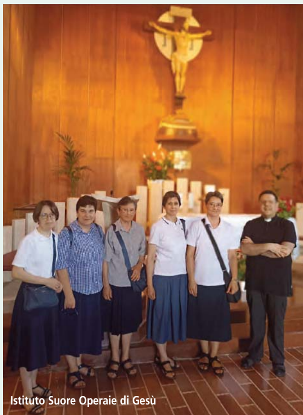
Istituto Suore Operaie di Gesù