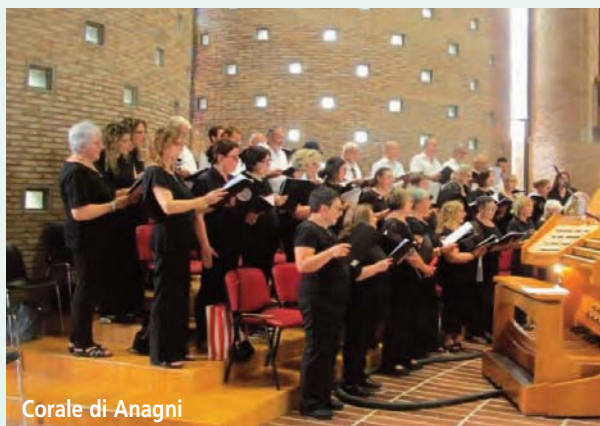
Corale di Anagni